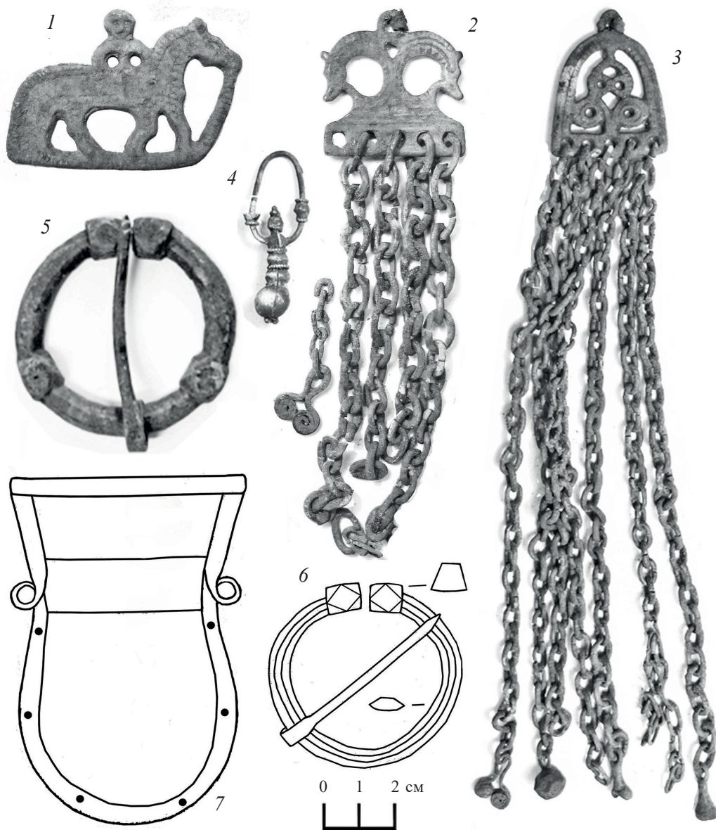
Рис. 1. Вещи из материалов могильника Кузинские Хутора, связанные с прикамским влиянием и западным импортом: 1 — погребение 18; 2 — погребение 23; 3 — погребение 25; 4 — погребение 31; 5 — находки местных жителей; 6, 7 — жертвенный комплекс 1