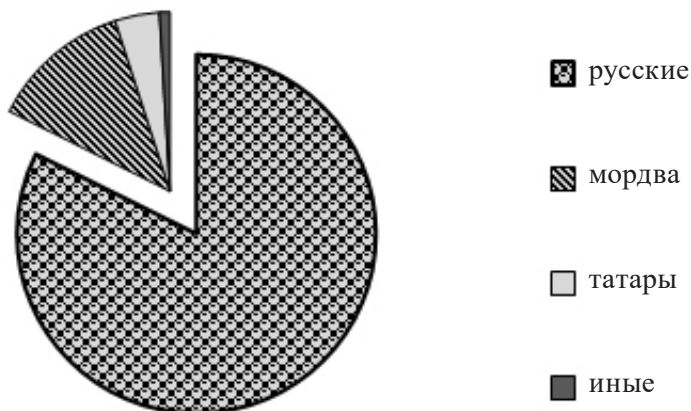
Рис. 1. Количество жителей, проживающих в 323 населенных пунктах на момент переписи (составлен по: Милонов Л. В. К вопросу об эволюции барщинных отношений в монастырском хозяйстве в середине XVIII в. // Проблемы генезиса капитализма. М., 1970. С. 291 — 300).

Темниковскому и Саранскому уездам основное внимание уделялось учету дворов и населения 7 .